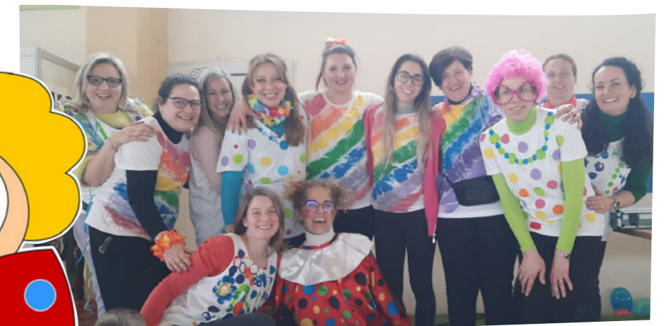
Le insegnanti e le educatrici